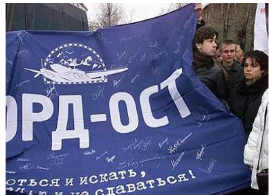
Рис. 6. Люди осуждают террористов

2004, 31 августа рядом со станцией метро