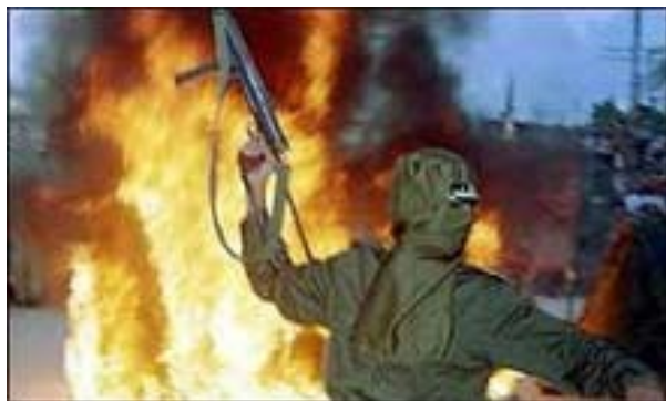
Рис. 4. Современный облик терроризма

Сегодня наблюдается резкий всплеск и качественные преобразования терроризма. Терроризм значительно расширил свою географию, охватил Латинскую Америку и Азию. Он обрел черты наступательности, высокой технической оснащенности, отличается изощренностью и жестокостью.