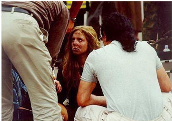
Рис. 2. Сразу после теракта

Отвечая на поставленный вопрос, необходимо подчеркнуть, что терроризм не есть что-то беспричинное или коренящееся в дефектах биологической природы человека. Это - явление, прежде всего, социальное, имеющее корни в условиях социального бытия людей. Именно здесь содержатся истоки потенциальных проблем