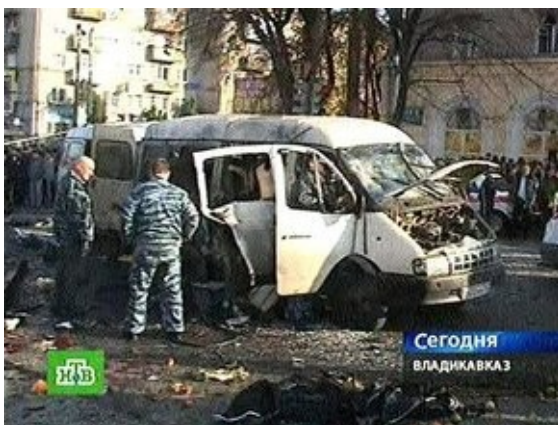
Рис. 7. Взрыв маршрутного автобуса

2007, 22 ноября взрыв в рейсовом "Икарусе", следовавшем из Кабардино-Балкарии в Северную Осетию. Пятеро пассажиров (в том числе ребенок) погибли.