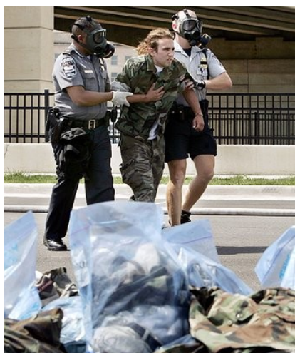
Рис. 13. Оказание помощи после взрыва

Необходимо помнить, что метро (помещения, вагоны) – это замкнутые пространства. Во-первых, здесь затруднены, а порой, невозможны свободные перемещения вследствие давки из-за паники, остановки поезда в тоннеле и т.п. Во-вторых, взрыв в замкнутом пространстве гораздо опаснее, чем на открытом воздухе, так как взрывной волне, образуемой давлением распространяющегося газа, некуда уходить, и она причиняет гораздо больше вреда, чем на открытом пространстве.