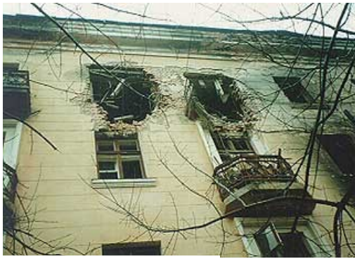
Рис. 5. После взрыва в доме

Вот лишь неполная хроника террористических актов на территории России: