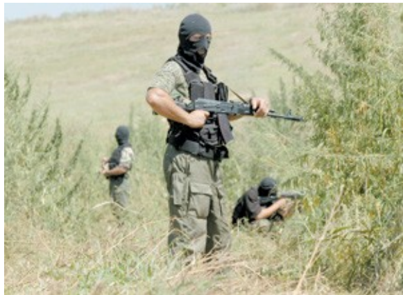
Рис. 11. Специальное подразделение проводит контртеррористическую операцию

На антитеррористические комиссии возлагаются функции координации деятельности территориальных органов исполнительной власти и органов местного самоуправления по профилактике терроризма, а также по минимизации и ликвидации последствий его проявлений. Комиссии возглавляют высшие должностные лица субъектов Российской Федерации.