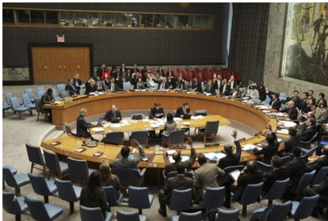
Рис. 10. Совет безопасности обсуждает проблему противодействия терроризму

Межрегиональный научно-исследовательский институт ООН по вопросам преступности и правосудия на основе анализа национальных стратегий борьбы с незаконной торговлей химическими, биологическими, радиологическими или ядерными материалами вырабатывает наиболее эффективные подходы в борьбе с незаконной торговлей этими материалами.