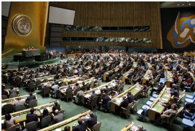
Рис. 9. Страны ООН - против терроризма

этом направлении проводятся на различных уровнях. На уровне глав государств и правительств, спецслужб, вооруженных сил, политических и общественных организаций и движений.