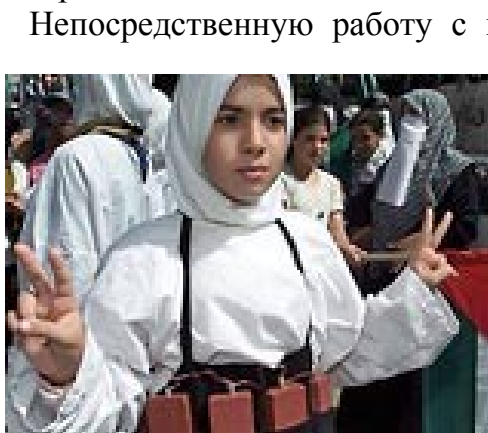
Рис. 12. Она готова стать террористкой

террористической акции шестнадцатилетнюю смертницу. Та, управляя грузовиком «Урал» с тремя тоннами взрывчатки, пыталась пробиться к военной комендатуре Ленинского района Грозного, но была ранена и задержана. Взрыв удалось предотвратить. 5