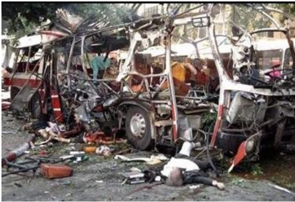
Рис. 3. Взрыв автобуса с людьми в Израиле

- политические похищения, имеющие целью добиться определенных политических условий, освобождения из тюрьмы сообщников и т.д.;